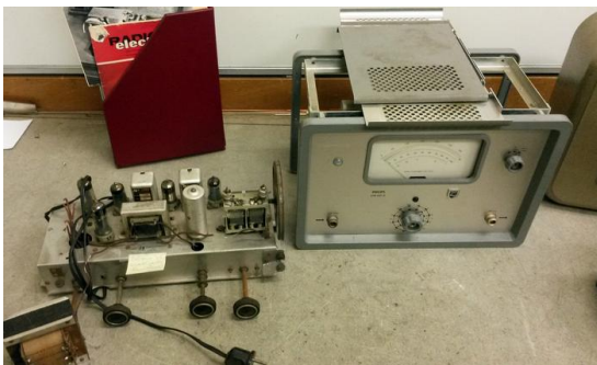
Enkele van de sinds maart gedoneerde apparaten.

Bezoekers van de open dagen op 18 en 19 april kwamen niet alleen kijken maar brachten ook wat mee. Zo kregen we (voor de onderdelen) een Philips buisvoltmeter, een zelf gebouwde ontvanger, diverse documenten en foto's, en een luidspreker en kiezer van de draadomroep.