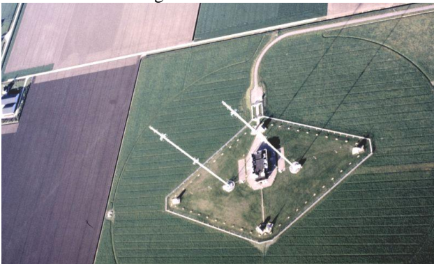
Op deze foto uit 1990 is het terrein goed te zien

Bij het ontwerp van de antenne is rekening gehouden met de bodemgeleiding en minimale fading binnen Nederland. Bij storingen of werkzaamheden kan het totale signaal aan één mast worden toegevoerd.