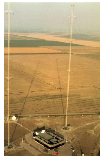
Het zendstation in 1979, het is dan in proefbedrijf

Na de frequentieconferentie van 1975 in Genève mocht Nederland met veel groter vermogen gaan uitzenden op de frequenties 747 en 1008 kHz. Het zendstation Lopik, waar vanaf 1940 op de middengolf wordt uitgezonden, was geen geschikte plek om nieuwe, veel grotere zenders, te plaatsen. Onderzoek gaf aan dat de nieuwe polder Zuidelijk Flevoland geschikt was om heel Nederland te verzorgen, met een kleine steunzender in Zuid-Limburg. In Flevoland werd op 22 maart 1978 de eerste paal geheid voor de bouw van een groot modern middengolf zendstation, dat 24 april 1980 door de staatssecretaris mw. Smit Kroes is geopend. Het zendstation was dan al enige tijd in (proef)bedrijf.