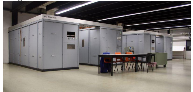
Links de zender van Radio 5 en rechts de reserve zender

Eén van de zenders is de reserve, bij storing van een bedrijfszender wordt de reserve zender automatisch op de goede frequentie afgestemd en met het antennesysteem verbonden. De uitgang van de defecte zender wordt dan verbonden met een kunstantenne, dit is een weerstand van 50 Ω die geschikt is om het uitgangsvermogen van de zender in warmte om te zetten. Zo kunnen reparaties en testen worden gedaan terwijl de uitzendingen gewoon doorgaan.